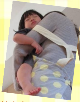
協力会員さんの腕の中ですやすや

③依頼会員に興味がある方へメッセージ ファミサポ利用で、自分の時間をもつことができます。心に余裕のある子育ての助けとなっています！