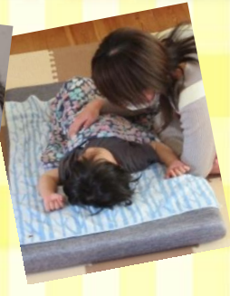
安心してお昼寝中！

③協力会員に興味がある方へメッセージ ファミサポは、会員さんやお子さんと信頼関係を築きながら、「仕事」ではないので自分の隙間時間に楽しく活動できます！