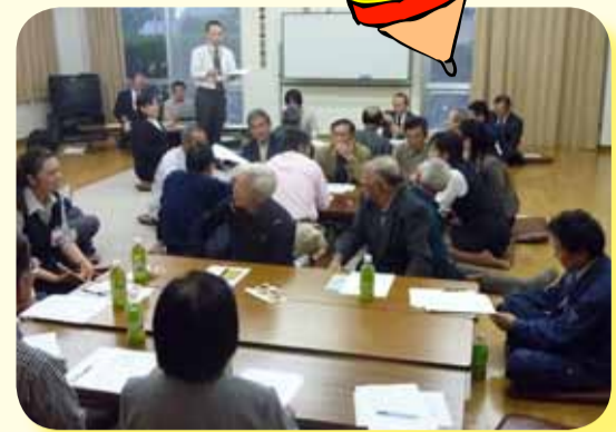
地域福祉活動計画策定における 地域福祉座談会(早月加積地区)