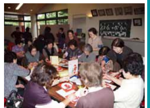
ボランティアの集い(同時開催)