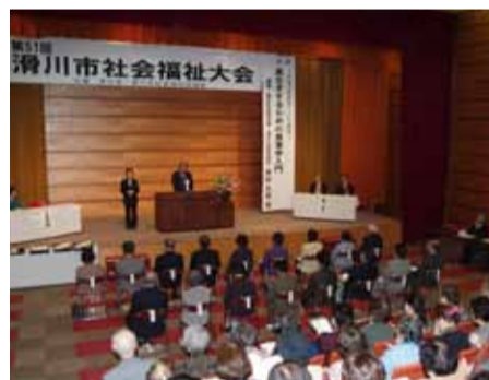
社会福祉大会式典の様子