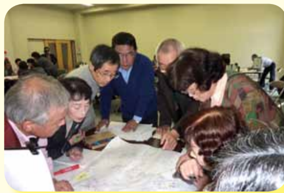
支え合いマップ活用セミナー (西加積地区)