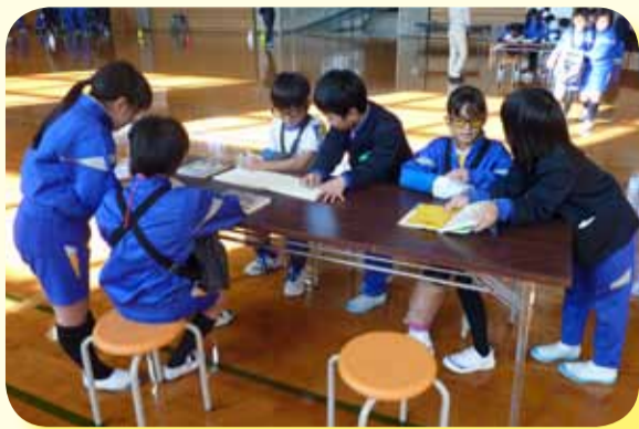
東部小学校 福祉教育出前講座 (高齢者疑似体験の様子)