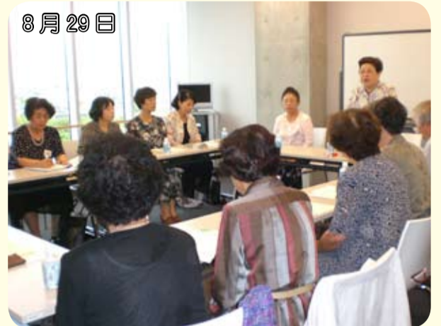
8月29日 滑川市VO連絡協議会と 大門VO連絡協議会との意見交換会