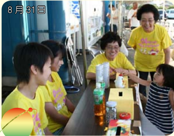
8月31日 約200名のボランティアが活躍 24時間テレビ 募金額 988,232円