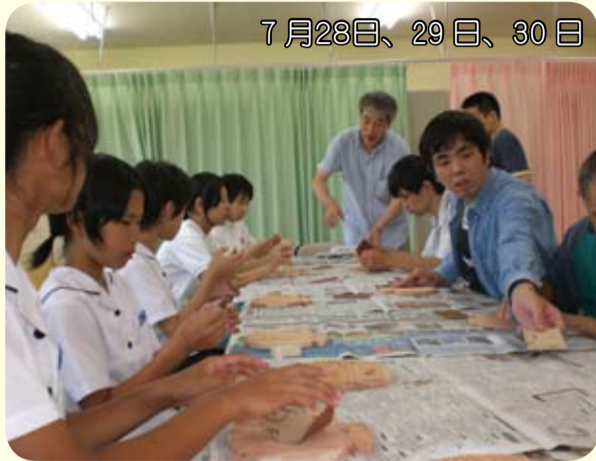
7月28日、29日、30日 中学生の夏休みボランティア (つつじ苑の皆さんとの交流会)