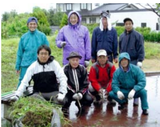
北野フォーユー倶楽部 草むしり活動での1コマ

非ご相談ください。 社会福祉協議会では、町内の安心・安全を守る「福祉見回り隊」活動の一環として、北野フォーユー倶楽部のように町内会単位で活躍するボランティア団体の設立を支援しています。ボランティア活動に関心のある方がおられましたら、是非ご相談ください。