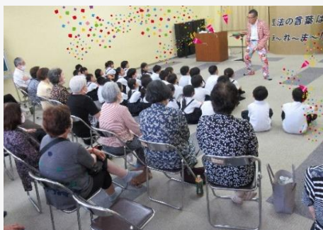
あ～れ～ま～ マジシャンショー！！

地域交流の場・健康づくりの場を提供し、高齢者の介護予防と生きがいづくり・地域の居場所づくりを応援しています。