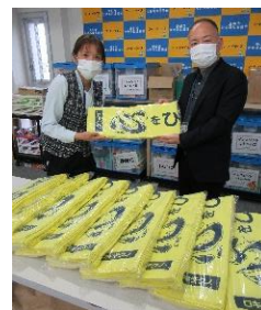
株式会社 ロキテクノ北陸事業所さんより、市内の子どもたちへとタオルの寄付を頂きました。

滑川善意銀行は、金額の大小を問わず皆様のあたたかい善意に基づく、金銭や物品等のご寄付(預託)を、各種福祉事業の推進やボランティア活動の振興に役立たせていただきます。