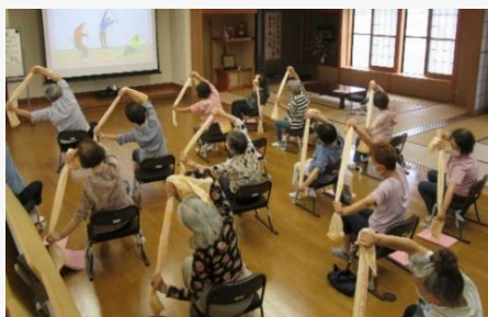
今日も元気はつらつ！！

令和5年5月から、新型コロナウイルス感染症の扱いが、いわゆる感染症法上の分類で5類となり、季節性インフルエンザ等と同じになりました。様々な地域活動もより活発になって行くことでしょう！